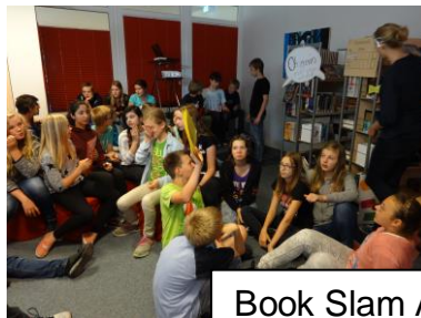
Book Slam AG

Wir werden in diesem Jahr schätzungsweise 300 Veranstaltungen anbieten können.