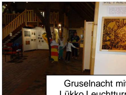
Gruselnacht mit Lükko Leuchtturm

Ca. 400 Veranstaltungen für Kinder und Jugendliche