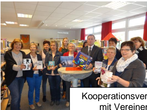
Kooperationsverträge mit Vereinen

Einige Landfrauenvereine und der Heimatverein Friedeburg sind Kooperationspartner der Mediothek. Die Mediothek möchte die Vernetzung örtlicher Vereine und Verbände protegiere sowie das Image der Kooperationspartner aufwerten. In diesem Jahr sind weitere Kooperationen geplant.